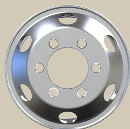
新型カムロード リアダブルタイヤ仕様専用アルミホイール 諸元表

12,000t 鍛造により、高剛性、高耐久を実現。JWL-T 規格を上回る強度を確保しています。